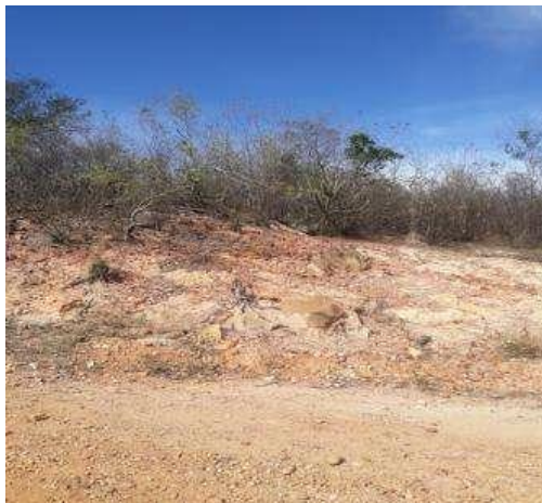
Fig. 5: Paisagem com Neossolo Litólico do geambiente 2, em Mirandiba-PE.