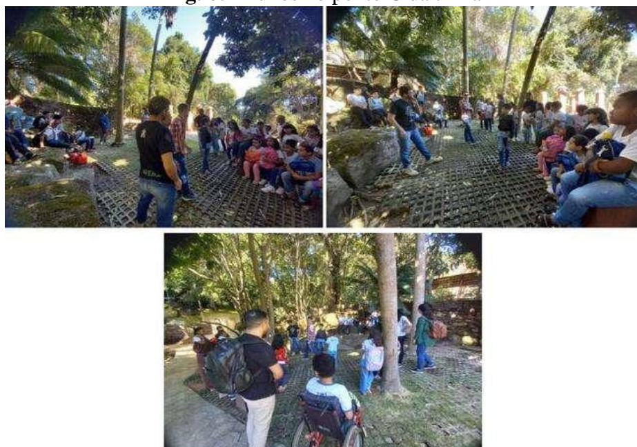
Fig. 05 Alunos no ponto C da trilha

fases desde o crescimento até a reprodução. Enfatizamos a importância da preservação da vegetação nativa e como a destruição por meio do desmatamento pode representar uma ameaça ao equilíbrio global. Destacamos que isso pode desencadear consequências sérias, como mudanças climáticas significativas, incêndios florestais e a introdução de espécies invasoras na região.