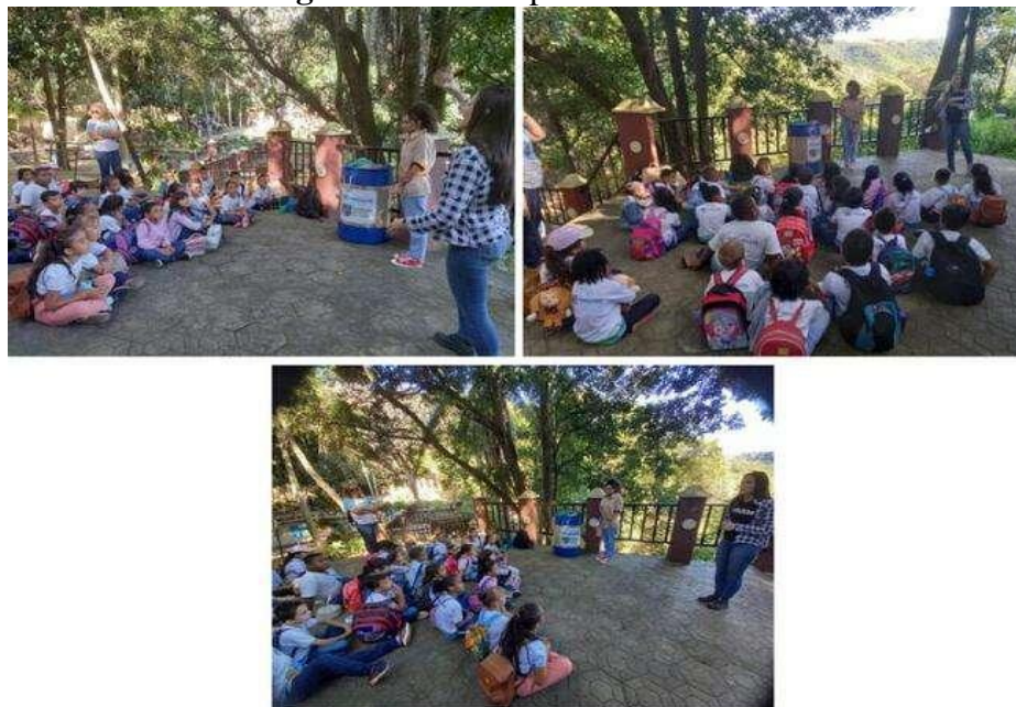
Fig. 04 Alunos no ponto B da trilha