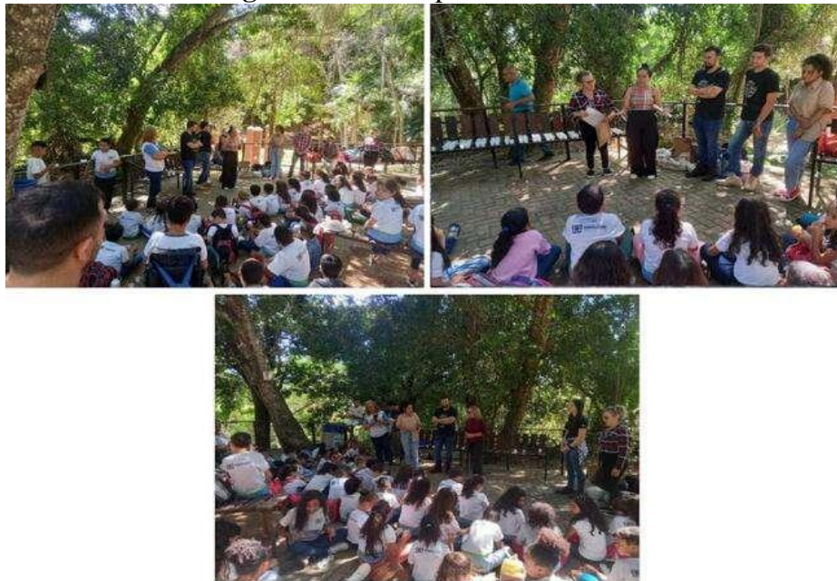
Fig. 06 Alunos no ponto D da trilha

discutimos a relevância da conservação do solo, enfatizando que ele é vulnerável a ameaças como o desmatamento, incêndios florestais e compactação.