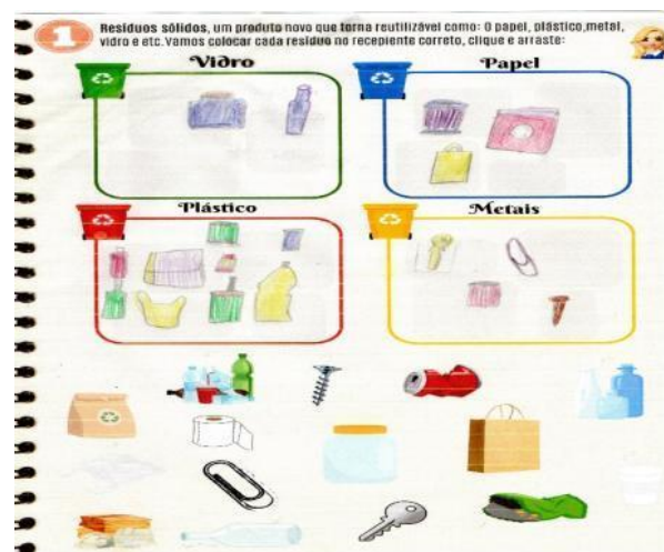
Fig. 3 Resposta do quiz interativo da aluna A7 do 2º ano do Ensino Fundamental da EMRSS em Boa Vista/RR.

No diagnóstico (pré-teste), na primeira questão, observar os Resíduos Sólidos apontados e, em seguida, adicionar cada um no recipiente adequado: vidro, papel, plástico e metal, por meio de desenho. Somente a aluna A7, conseguiu responder corretamente o que era solicitado, demonstrando domínio sobre o assunto, pelo fato de já ter estudado na série anterior, como pode ser observado na figura 3.