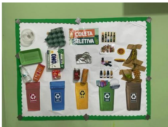
Fig. 6 Construção do mural interativo utilizando Resíduos Sólidos pelos alunos do 2º ano do EF da EMRSS em Boa vista/RR.

Os alunos foram convidados a construir coletivamente um mural interativo utilizando os Resíduos Sólidos coletado na aula de campo, mediante a orientação e auxílio da pesquisadora (figura 6).