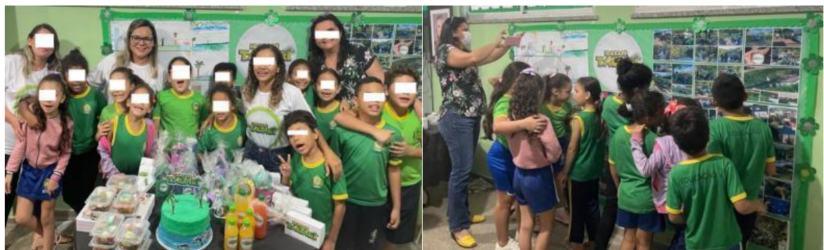
Fig. 7 Culminância da pesquisa com os alunos do 2º ano do EF da EMRSS em Boa vista/RR.

Assim, para encerrar a aplicação da SD, foi organizado um momento de descontração com os alunos (figura 7), onde eles receberam uma lembrancinha confeccionada com caixa de leite e lata pequena de goiabada, contendo bombons, chocolates e outras guloseimas, como forma de mostrar como alguns materiais podem ser reciclados e reutilizados, e, ainda agradecer pela disponibilidade em querer participar da pesquisa.