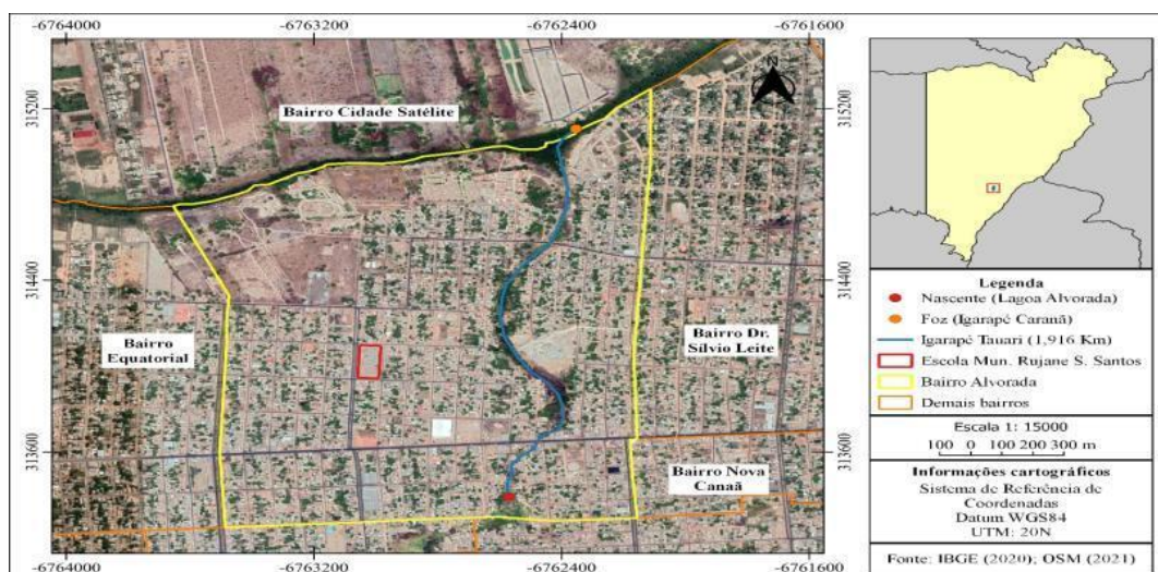
Fig.1 Localização do igarapé Tauari em Boa Vista/RR.

Num contexto geral, juntas, educação formal, não formal e informal, fazem parte de um todo e contribuem para a formação integral do indivíduo. No entanto, como o foco deste estudo, O igarapé Tauari (figura 1), está localizado na cidade de Boa Vista/RR, zona Oeste de Boa Vista/RR, no bairro alvorada com 38 ruas e vias, 7.914 habitantes, a urbanização espacial é composta de drenagem, asfalto, calçadas, meio-fio, presença de bueiro, pavimentação e meio-fio. Possui iluminação pública, rede elétrica, água encanada, rede telefônica, suas vias possuem sinalização para facilitar a circulação (IBGE, 2021), apresenta-se em desenvolvimento progressivo, pois tem sido atendido pelo Projeto de Mobilidade Espacial da PMBV.