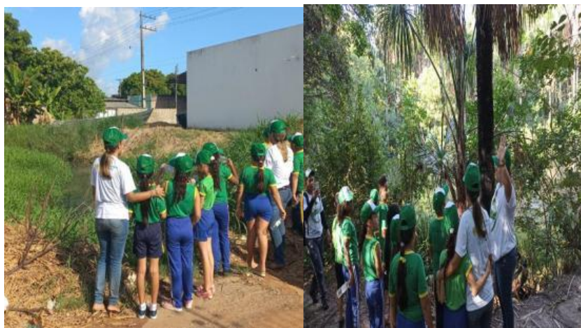
Fig. 4 Visita de campo na bacia do igarapé Tauari com alunos do 2º ano do EF da EMRSS em Boa Vista/RR.

Durante a visita ao igarapé Tauari, os alunos tiveram a oportunidade de verificar, entre outros aspectos, a coloração da água, animais dentro e ao entorno, fauna e flora e os resíduos sólidos (figura 4).