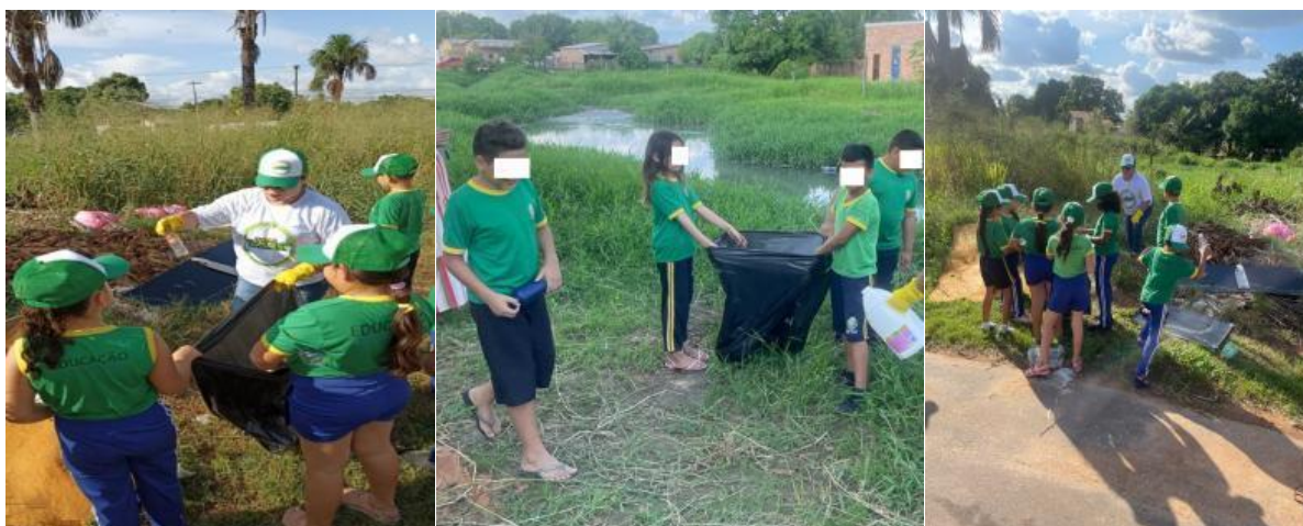
Fig. 5 Coleta dos Resíduos Sólidos durante a visita realizada com alunos do 2º ano do EF da EMRSS em Boa Vista/RR.

Para a coleta dos Resíduos Sólidos, como proposto na SD, foi fornecido sacos de lixo de 200 L, onde cada material encontrado, após ser apresentado pela pesquisadora, foi abordado sobre tempo de decomposição, material utilizado em sua fabricação, problemas causados ao meio ambiente etc., ele era recolhido e guardado (figura 5).