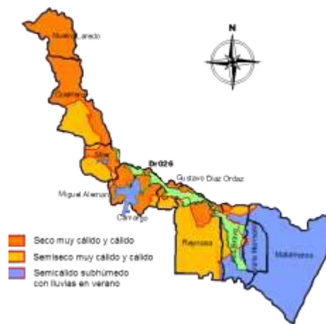
Fig. 1 Distribución de climas en la zona de estudio

Köppen modificado por García: el clima es BSo(h')hx'(w)i, que indica un clima seco, el más seco de los BS con lluvias escasas todo el año, la temperatura media anual de 22.8°C, máxima de 40°C en julio y mínima debajo de 0°C en los meses de noviembre a marzo; el BS1(h')hx' clima semiseco muy cálido y cálido, con una temperatura media anual mayor de 22 °C, la temperatura del mes más frío de 18 °C; el (A)Cx' que pertenece a los tipos semicálidos subhúmedos con lluvias escasas todo el año, una temperatura media anual mayor a 18° C (Figura 1).