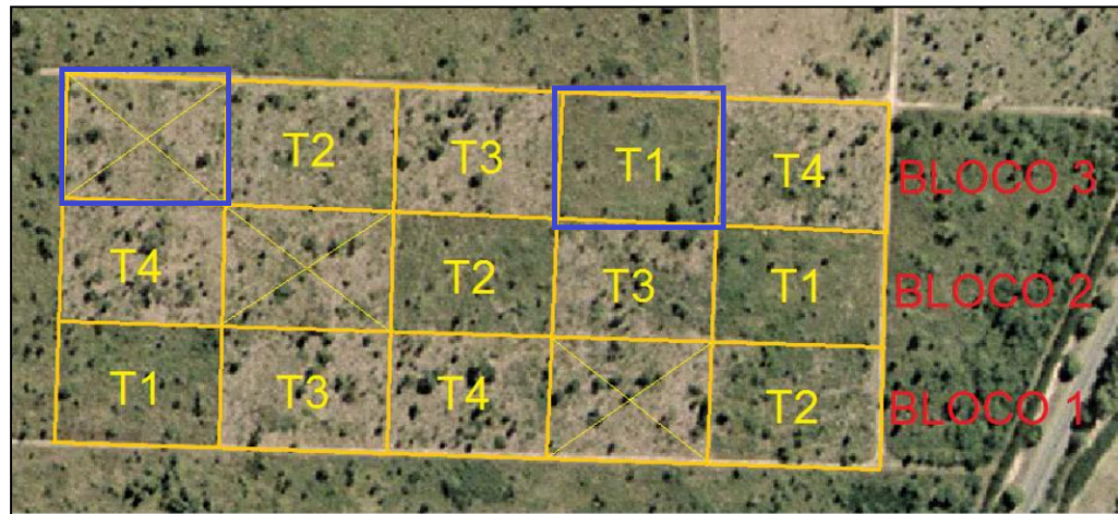
Figura 2 – Esquema de divisão dos tratamentos que passaram pelas estratégias de restauração na área de estudo na RNV, Linhares - ES, com destaque em azul para o tratamento 1 e o tratamento 2, analisados nessa pesquisa