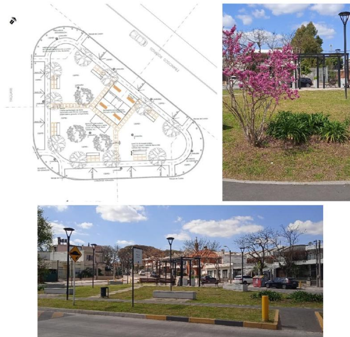
Figura 2. Diseño y fotografías de Plaza Teresa de Calcuta

El resultado puede verse en la Figura 2.